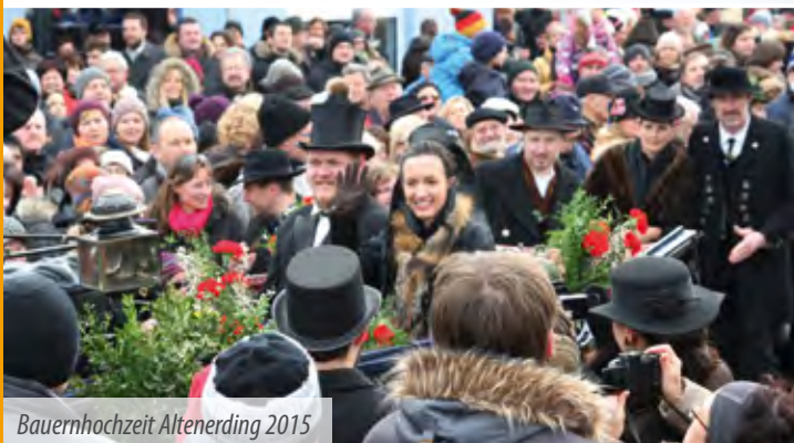
Bauernhochzeit Altenerding 2015