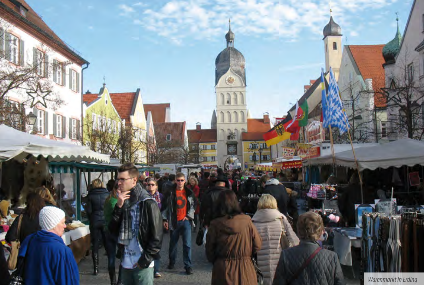
Warenmarkt in Erding