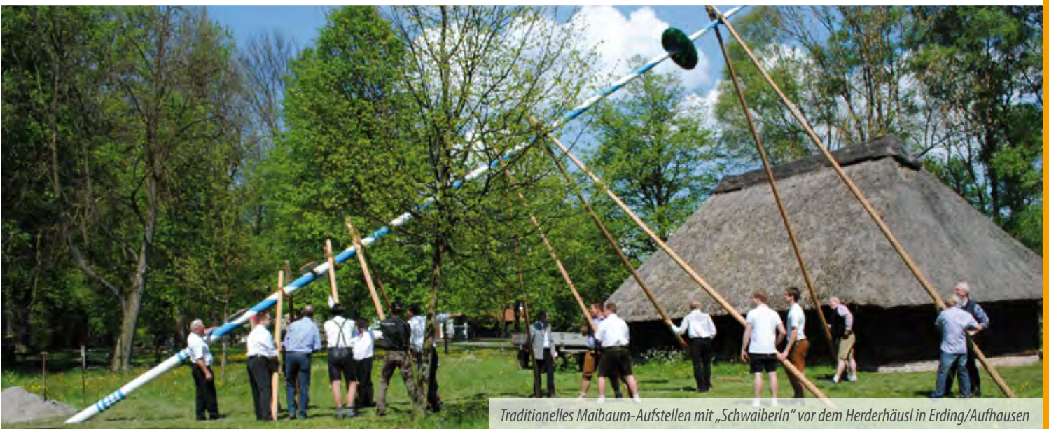
Traditionelles Maibaum-Aufstellen mit „Schwaiberln“ vor dem Herderhäusl in Erding/Aufhausen