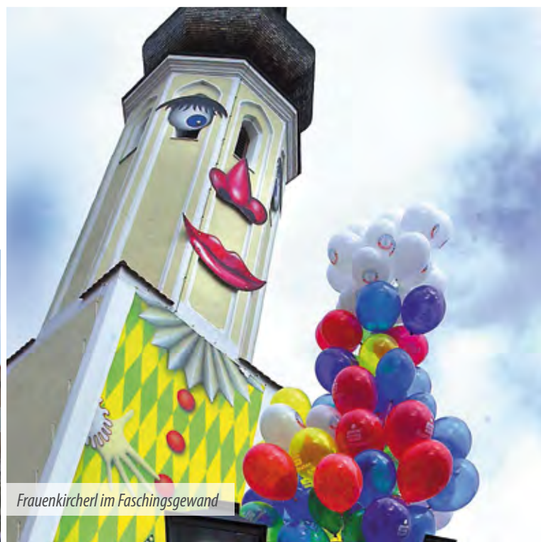
Frauenkircherl im Faschingsgewand

► Weitere Informationen: Faschingsgesellschaft Narrhalla Erding e.V., www.narrhalla-erding.de