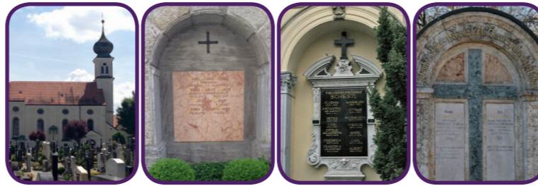
Foto 1 - 1. Station Friedhof St. Paul